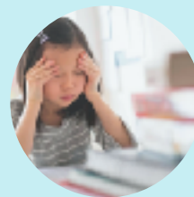
「超級情感敏銳型」 Super Feeler