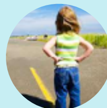
「自主性極強型」 Strong Willed