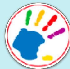
「特殊需要型」 Special Need