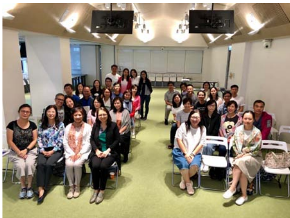
「你有Point我有Point 情理兼備 化解衝突」家長工作坊（銅鑼灣同福堂）

9月15及28日，本學院分別為屯門及銅鑼灣播道會同福堂舉辦了兩場分別是三小時及一整天的家長工場，兩所教會的家長子女年齡迥然不同，屯門堂家長多為小學生，銅鑼灣堂的家長則主要是中學及大學生。困難各有不同，但我們都看到父母的疲累、擔心確因愛而至。通過工作坊讓家長了解單單停留在子女的問題上，只叫人更疲倦，而由情緒入手的應對及處理方式，是滿足核心底層的情感需要時，效果很不一樣。