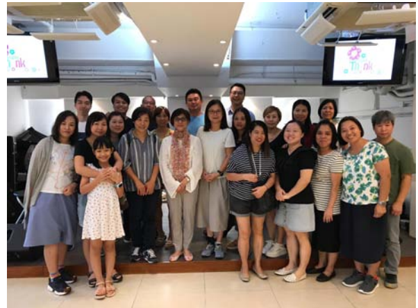
「共情共鳴親子情」家長工作坊（屯門同福堂）